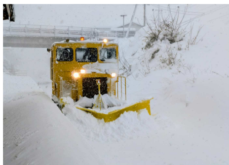
排雪モーターカー除雪